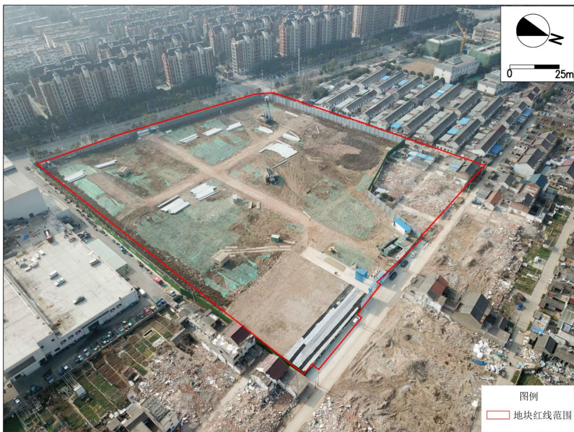
图 2.2-4 调查地块现场图（航拍图）

根据现场踏勘情况表明，调查地块内主要为空地，地势整体较为平坦，地面无污染痕迹，无异味。具体情况见图 2.2-4。