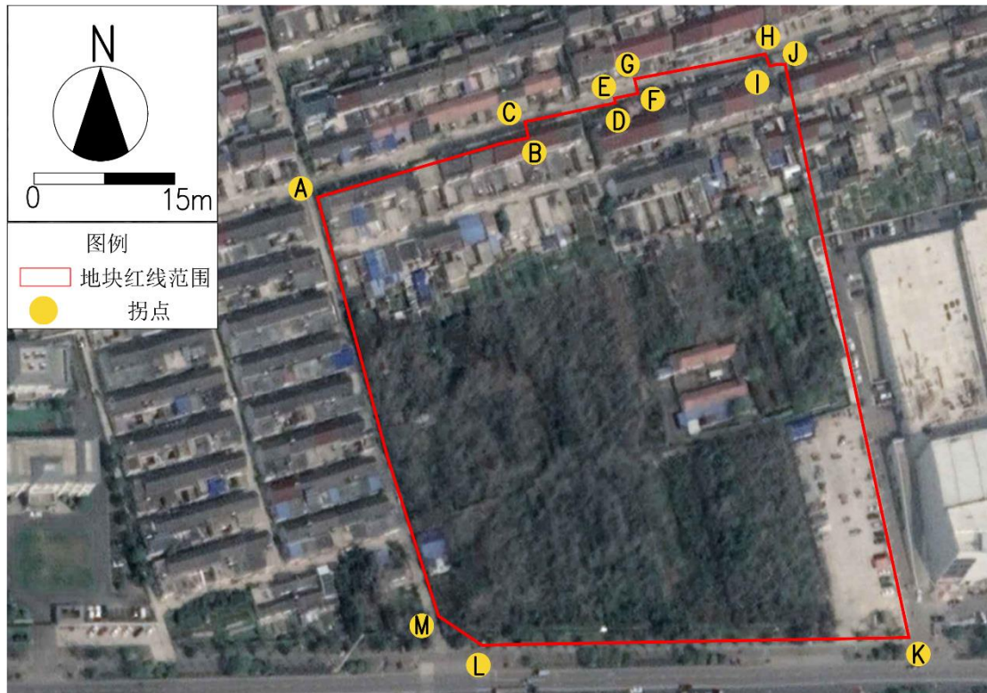
图 1.1-2 调查地块范围红线图