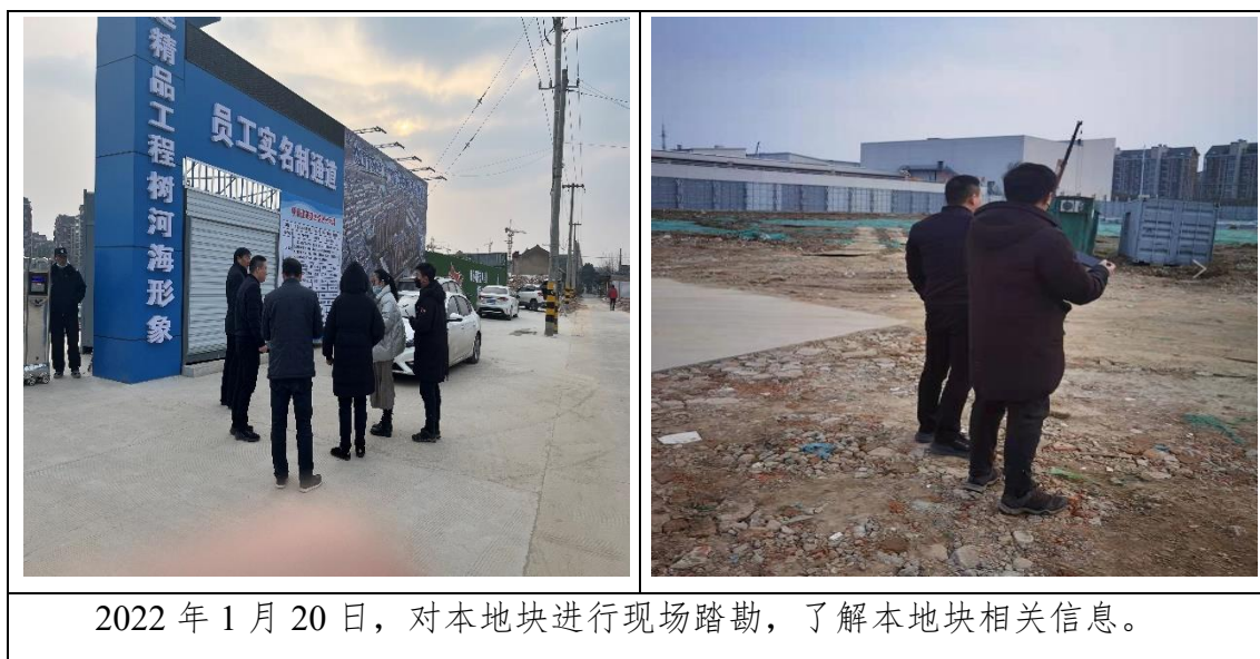
图 2.2-1 现场踏勘图