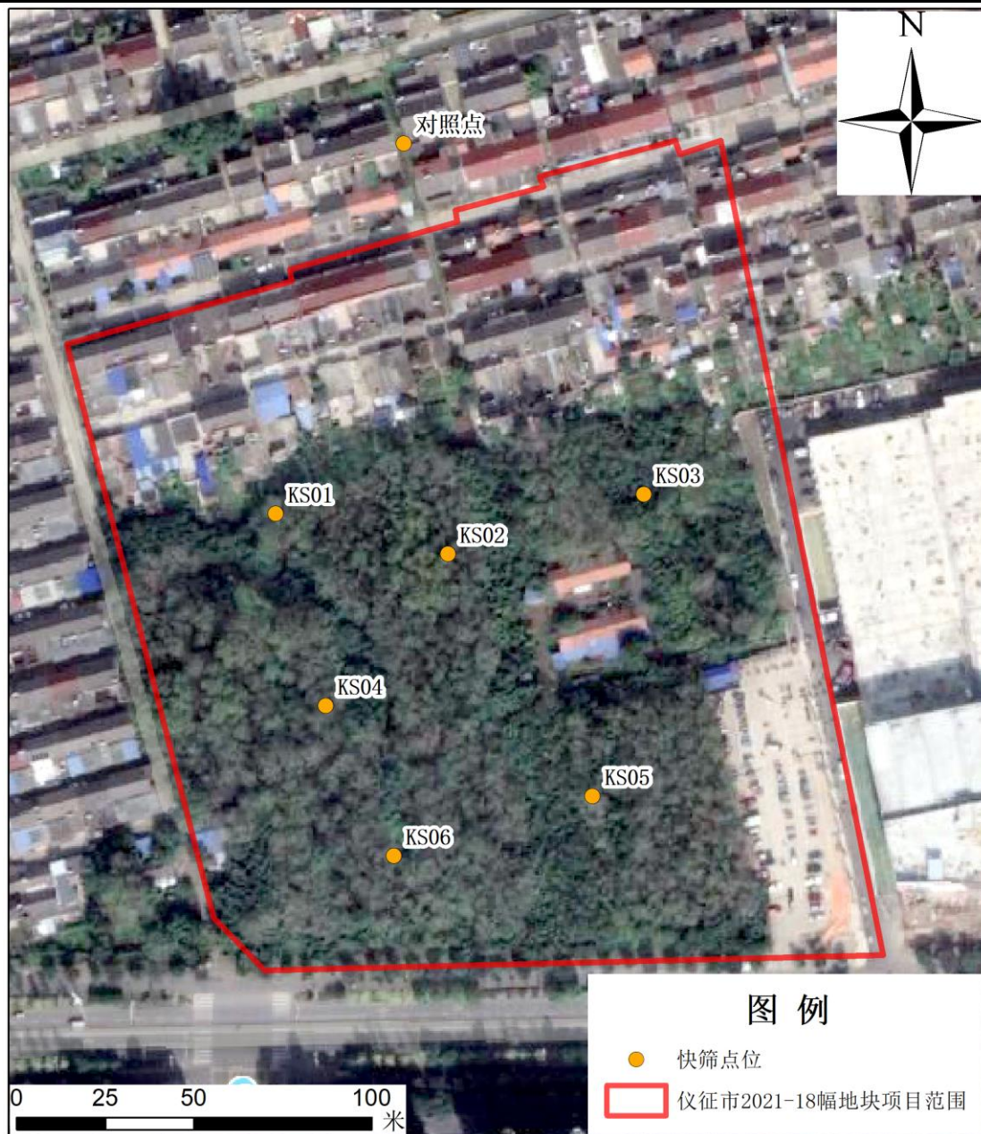
图 2.2-4 现场快筛点位图